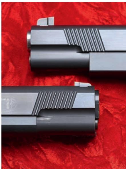
Beide Modelle setzen auf Durchladerillen im vorderen Schlittenbereich für Waffenmanipulationen.

Nun wurde die 1911 „Sentry“ im Klassikerformat in die Schießmaschine eingespannt und schon nach den ersten Setzschüssen zeichnete sich ab, dass diese Pistole über ein hohes Präzisionspotential verfügte. In der folgenden, eigentlichen Präzisionsüberprüfung teilten sich den ersten Platz mit sagenhaften 15 mm (!) die GECO 124 Grains Hexagon und die Federal American Eagle 147 Grains FMJ. Platz Zwei ging an die Hornady 115 Grains XTP American Gunner mit 22 mm. Nur theoretisch schlechter war unsere Handladung mit dem 124 Grains GECO Hexagon Geschoss in Verbindung mit 3,8 Grains Hodgdon Titegroup und einer 23 mm messenden Gruppe. Da hier sechs Ergebnisse im Bereich von 30 mm und darunter lagen, wundert es kaum, dass sich der Durchschnittswert bei erstklas-