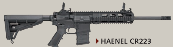
► HAENEL CR223

Konzipiert für den harten Einsatz, jetzt auch für den sportlichen Wettbewerb. Der Herausforderer in der M16-Klasse made in Germany. Qualität und Präzision aus Suhl.