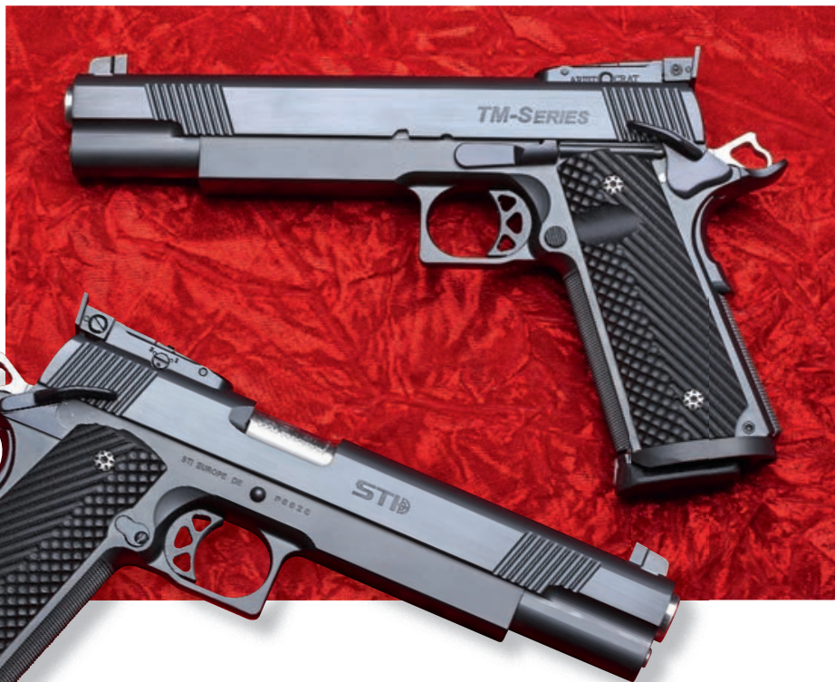
Die STI Europe „TM Series“, eine 1911-A1 Longslide mit schwerem Griffstück und Mehrpositionen-Visier, die an das Vorbild der STI Target Master anknüpft, in beiden Seitenansichten.

Die Produktion der Pistolen unter neuer STI-Europe-Flagge ist schon länger angelaufen. Aufgrund der Reputation von Prommersberger als Kurzaffen-Tuningspezialist ist die Nachfrage größer als das Angebot und somit dank üppiger Vorbestellungen keine Lagerware vorhanden. Umso erfreulicher, dass wir doch zwei der universellsten Modelle im Kaliber 9 mm Luger für einen Test erhielten. Die beiden 1911 „Single Stack“-Modelle „Sentry“ und „TM-Series“ bauen auf einem schlanken Rahmen für einreihige Magazine auf. Während die „Sentry“ (englisch für: „Wache“) mit 5“-Lauf dem klassischen Entwurf und Format von John M. Browning und der ehemaligen U.S. Army-Dienstpistole entspricht, stellt die „TM-Series“ eine sportlichere Longslide-Variante mit