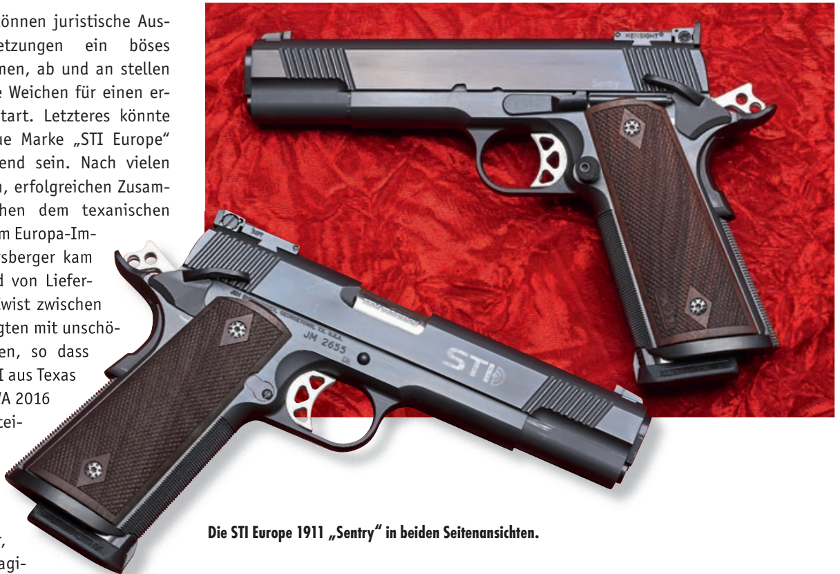
Die STI Europe 1911 „Sentry“ in beiden Seitenansichten.

Zu Deutsch: „Leg Dich nicht mit Texas an!“ lautet ein typischer Spruch des zweitgrößten US-Bundesstaates. Ob die