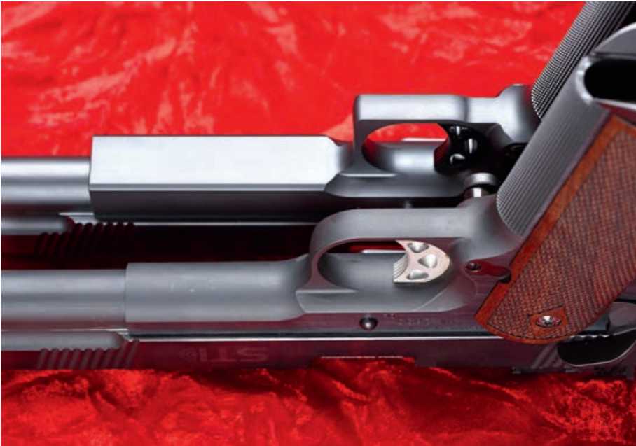
Der massive Rahmen der „TM Series“ wirkt im Vergleich zur „Sentry“ erst richtig deutlich.

finishes und eine praxisnahe Vollaustattung sind ihre Markenzeichen. Die Abzüge waren zudem schon von Hause aus gut voreingestellt, somit sind die 1911er-Sportpistolen also direkt „out of the box“ wettbewerbsfähig. Die Schussleistung der „TM-Series“ geht in Ordnung und im Falle der uns vorliegenden „Sentry“ war sie sogar überdurchschnittlich gut. Somit gehen die Preise von 2.270 Euro für die „TM Series“ und 2.150 Euro für die „Sentry“ voll in Ordnung.