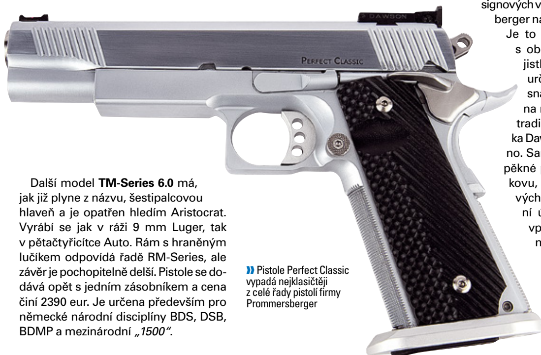
» Pistole Perfect Classic vypadá nejklasičtěji z celé řady pistolí firmy Prommersberger

Tahle pistole, která má blízko k laděné klasice, jak ji známe, se